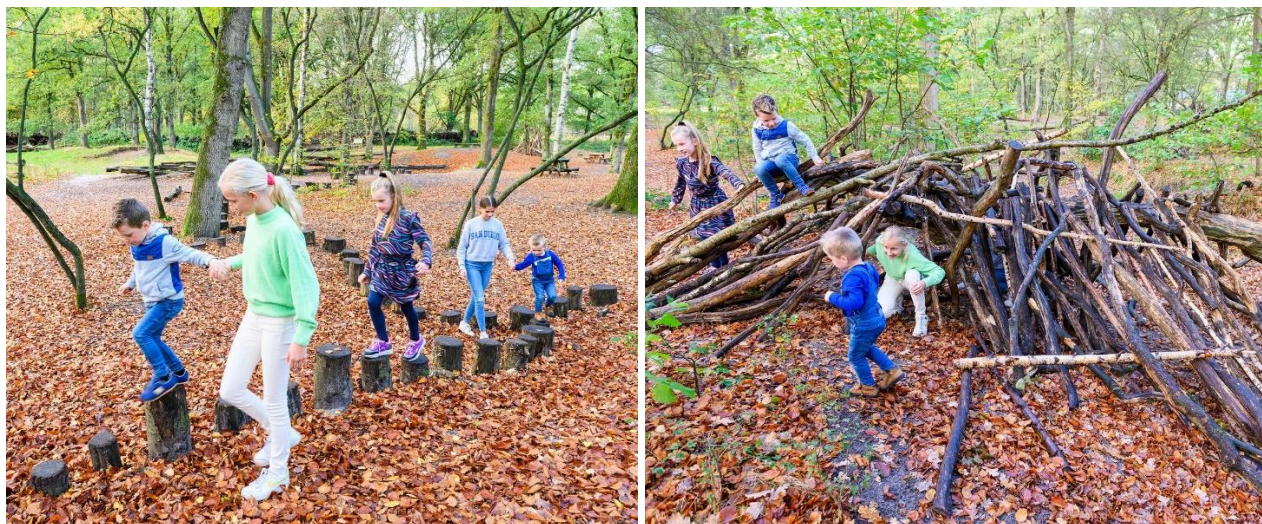
figuur 1. Beeldmateriaal speelbos 't Laer – Oude Postweg 1 te Laren

Om een beeld te vormen hoe het nieuwe speelbos eruit moet komen te zien, is een referentie belangrijk; beelden zeggen immers veel meer dan woorden. Daarmee kan een goede indruk worden verkregen hoe het speelbos wordt ingericht. GNR ziet speelbos 't Laer als referentieproject. Onderstaande afbeeldingen geven een beeld van de speelaanleidingen in speelbos 't Laer, waarbij separaat (bijlage 1) meer beelden van het speelbos en daarin de speelaanleidingen zijn bijgevoegd.