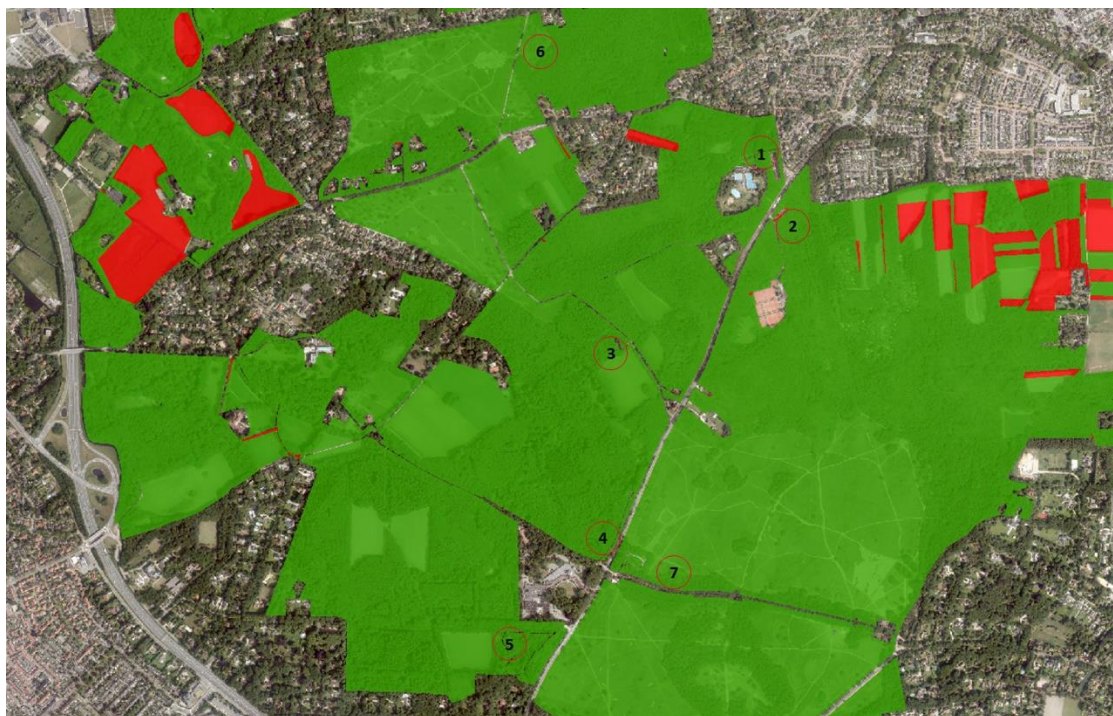
figuur 3. Situering mogelijke locatie i.r.t. NNN-contour, waarbij 'groen' gerealiseerd NNN-gebied aanduidt en 'rood' NNN-gebied duidt dat nog niet is ingericht