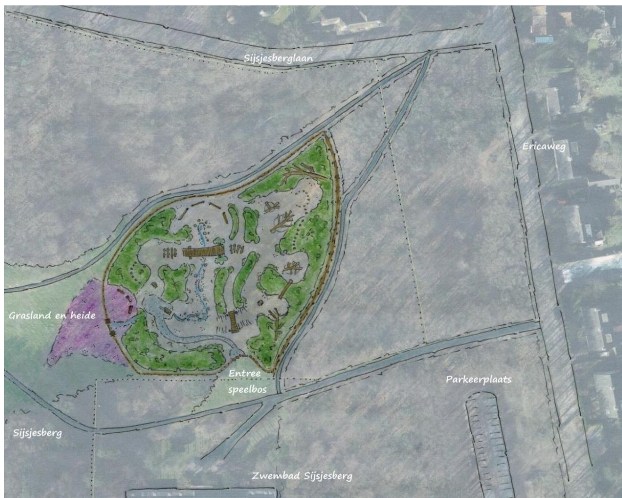
figuur 4. Schetsontwerp speelbos Sijjesberg (Paul van Eerd, Buro Buiten Ruimte, september 2020)