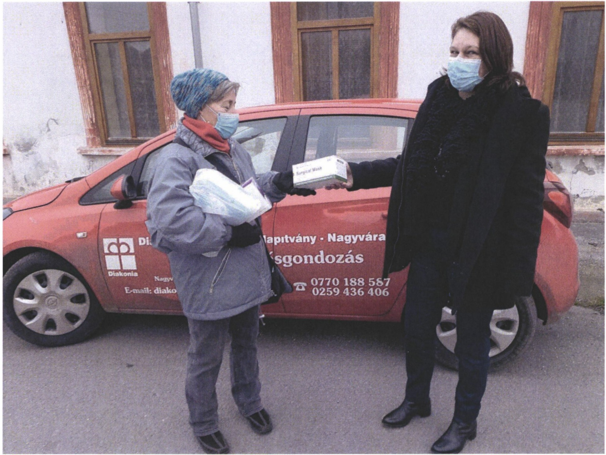
Materiale geven aan medewerker