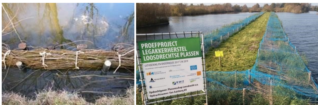
Een eenvoudige en complexere uitvoering rijshout wiep

Deze zal van rijshouten wiepen worden gemaakt. Dit is duurzaam en goed voor waterplanten, vissen en omgeving. Tevens is dit passend in de natuurlijke omgeving.