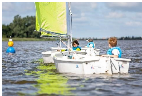
Optimist – wendbare kinderzeilboot 2.2

Het zeilen voor kinderen in de leeftijd van zes tot en met twaalf jaar zal plaatsvinden in de zomerweken. De bootjes waarin ze varen zijn kleine wendbare zeilbootjes, van het type optimist , die de kinderen in hun eentje kunnen besturen. De cursussen zijn van maandag tot en met vrijdag van 09:00 uur tot 17:00 uur. Deze activiteit is een alternatief in de zomer voor de buitenschoolse opvang.