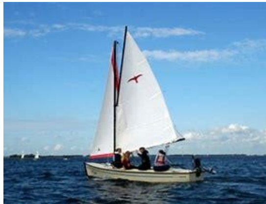
Polyvalk – kielboot

De lessen voor volwassen vinden plaats in de periode mei tot oktober in de avonden en weekenden. Er wordt gevaren met een open kielboot van het type valk . Per valk kunnen maximaal vier cursisten en een instructeur plaatsnemen.