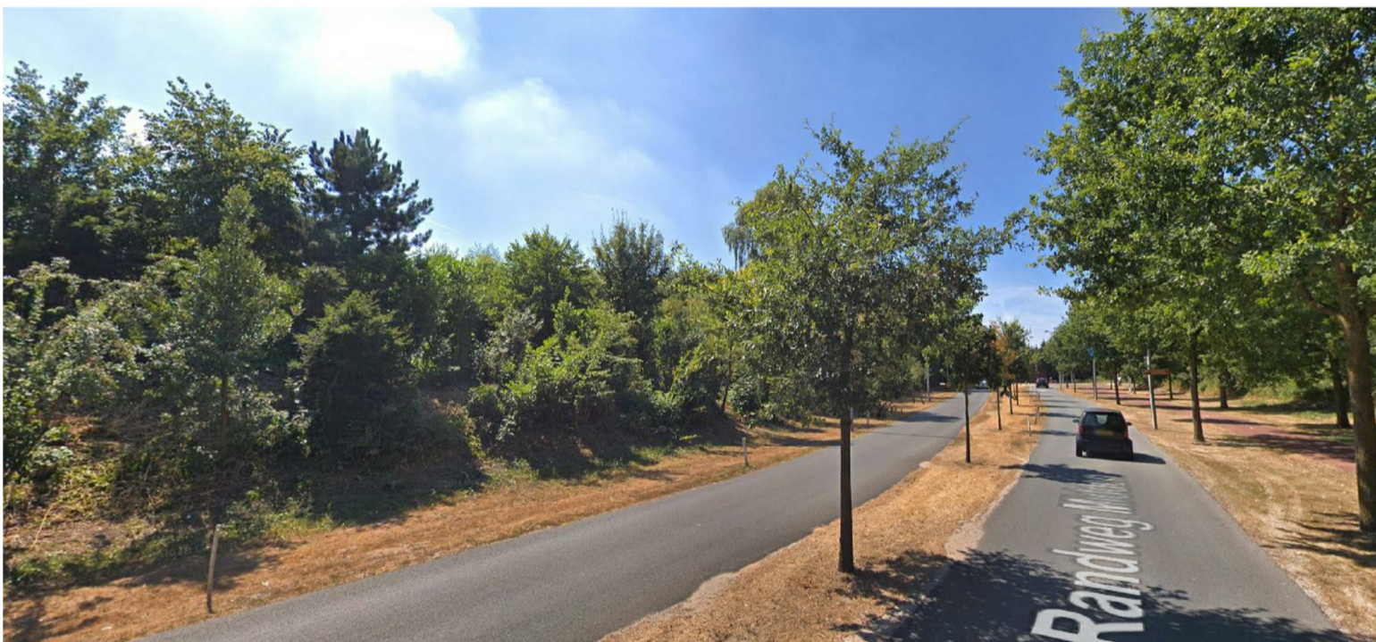
Veel groen vanaf de Randweg