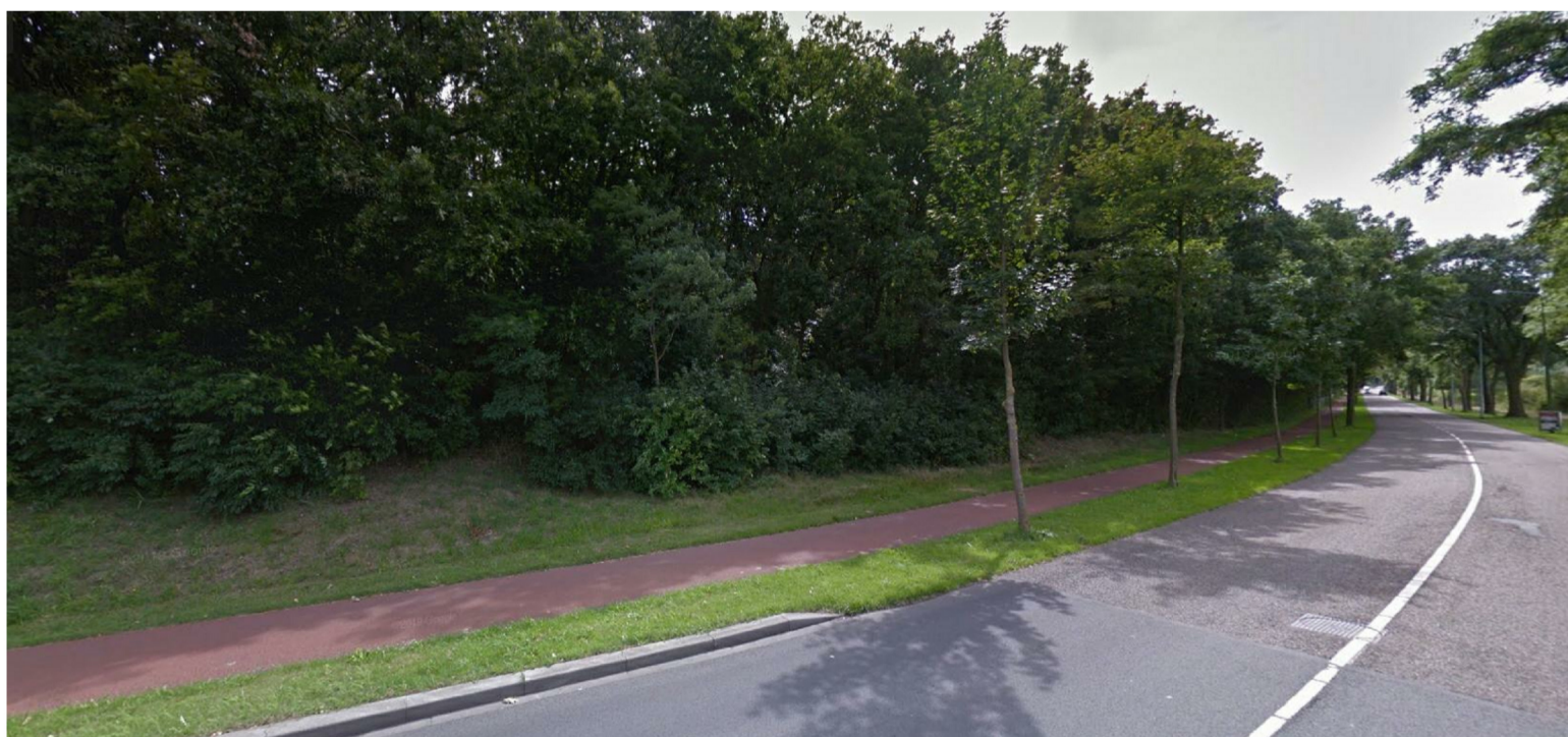
Zicht vanaf de Blauwumersstraat