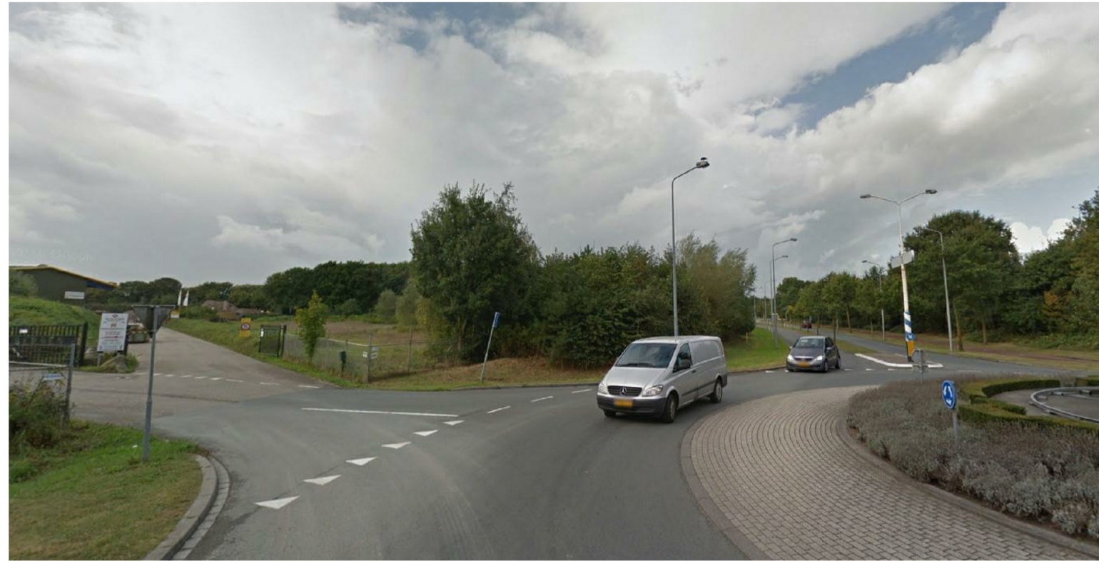
Inrij vanaf de rotonde