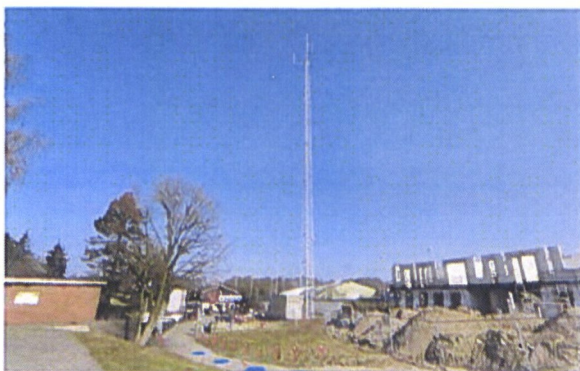
C2000 mast, naast toegang Skiclub

Gevraagd wordt om op grond van artikel 3.1 toestemming te verlenen voor bijplaatsing van een antenne door derden.