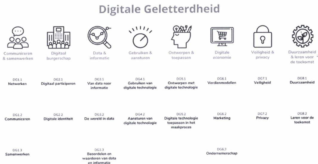
Figuur 2: Advies curriculum digitale geletterdheid

Samengevat ziet het voorgestelde curriculum voor digitale geletterdheid er als volgt uit: