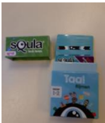
SQULA TAAL RIJMEN

Net als in 2020 waren er ook in 2021 lockdowns waardoor wij genoodzaakt werden om in deze periodes, met pijn in het hart, de Speel-o-theek te sluiten. Juist in lockdown periodes is de behoefte aan (aangepast) speelgoed groot. De eerste maanden van 2021 was het niet mogelijk speelgoed te lenen. In totaal zijn we 13 weken door corona dicht geweest. In de overige maanden zijn we vrijwel alleen op afspraak open geweest, soms zelfs alleen als ophaalpunt via 'click en collect'.