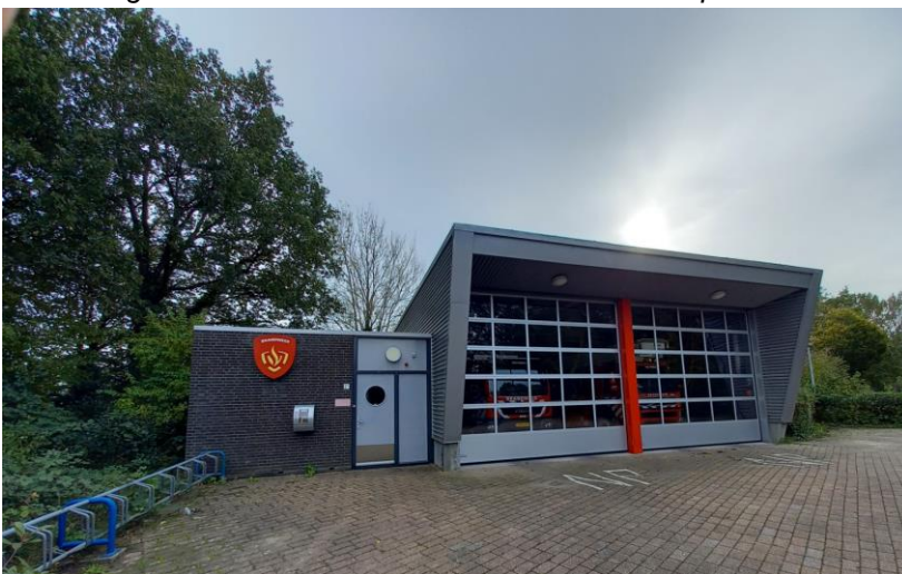
Afbeelding 1 – Vooraanzicht van het brandweersteunpunt.