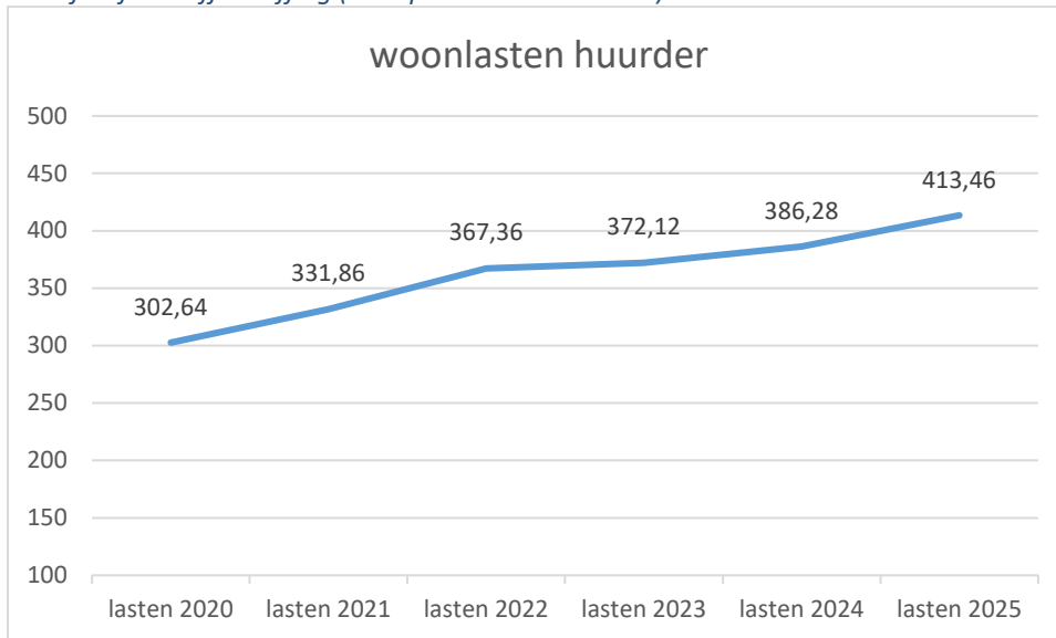
Tabel 3: Tariefontwikkeling woonlasten in Huizen afgelopen 6 jaar (huurder) Betreft: afvalstoffenheffing (meerpersoonshuishouden).

De stijging van de gemeentelijke woonlasten in 2025 ten opzichte van 2024 bedraagt in Huizen 7,0% voor de huurders.