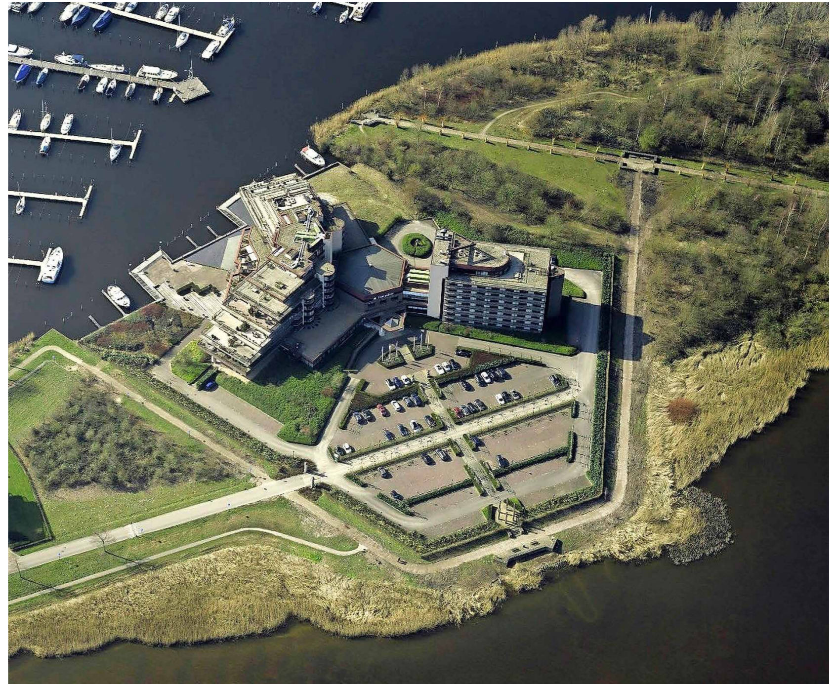
- Residentie Gooier Hoofd Huizen, Nederland