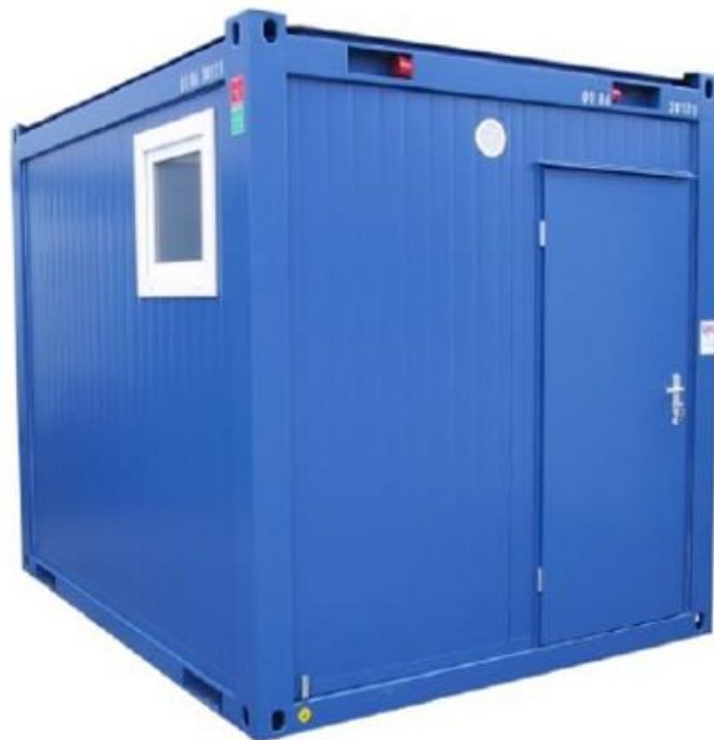
Figuur 2. Visuele impressie sanitaire unit.