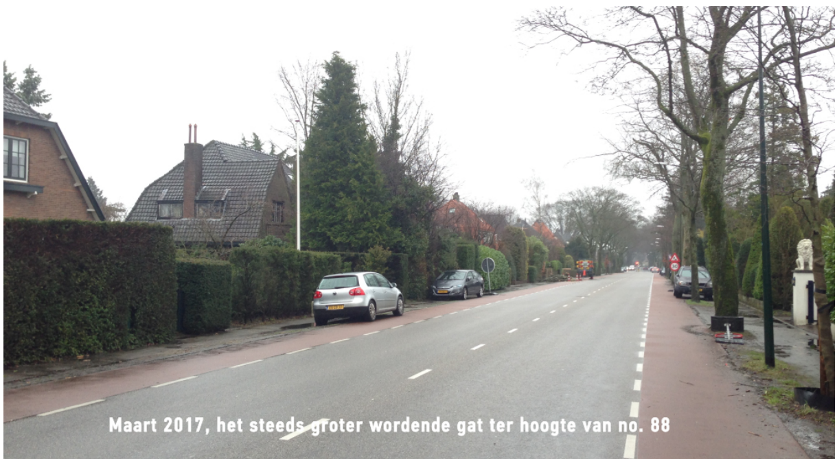
Maart 2017, het steeds groter wordende gat ter hoogte van no. 88