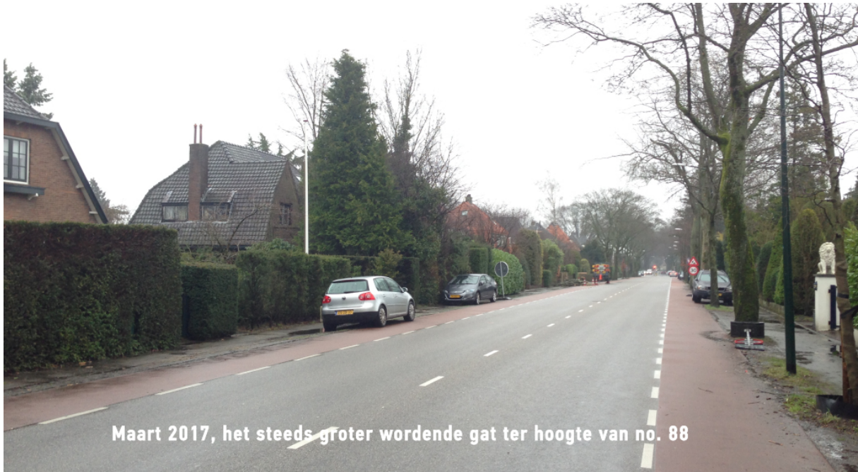
Maart 2017, het steeds groter wordende gat ter hoogte van no. 88