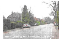
De recente veranderingen in een deel van de 'groene entree' met commentaar van de bewoners.