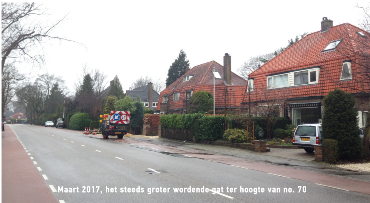
Maart 2017, het steeds groter wordende gat ter hoogte van no. 70