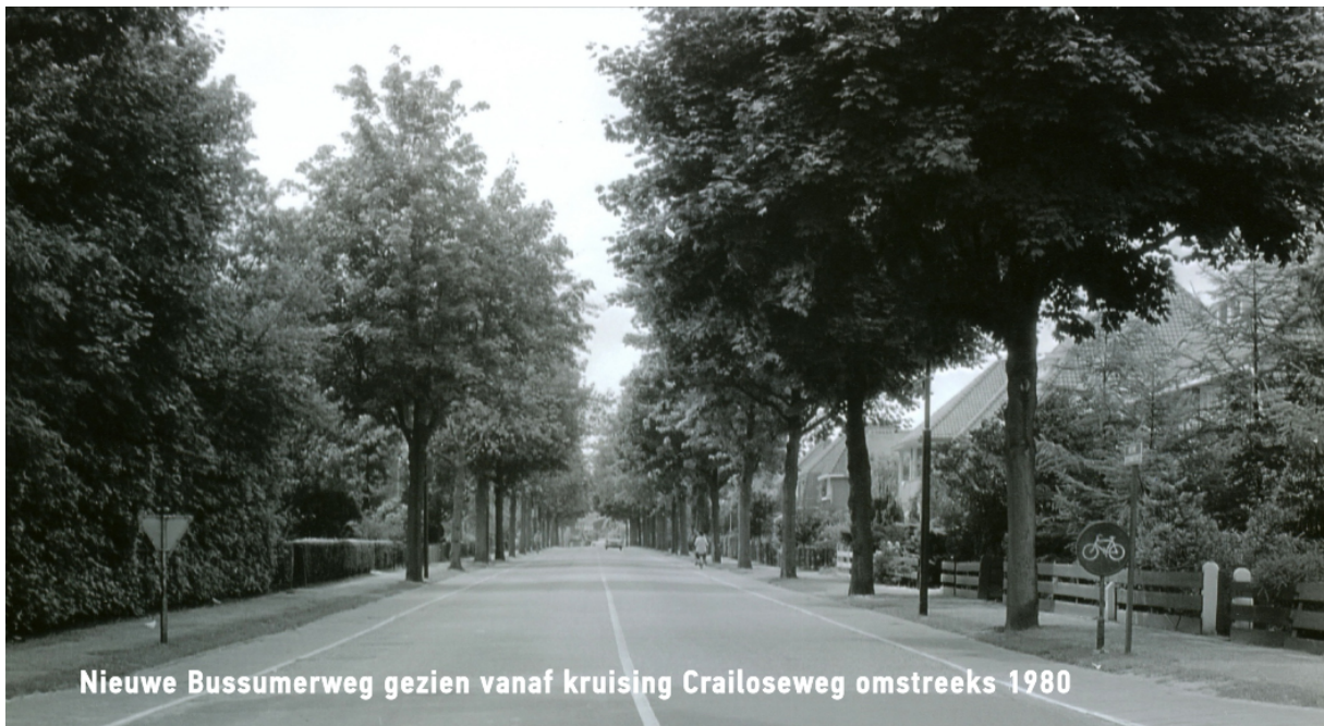
Nieuwe Bussummerweg gezien vanaf kruising Crailoseweg omstreeks 1980