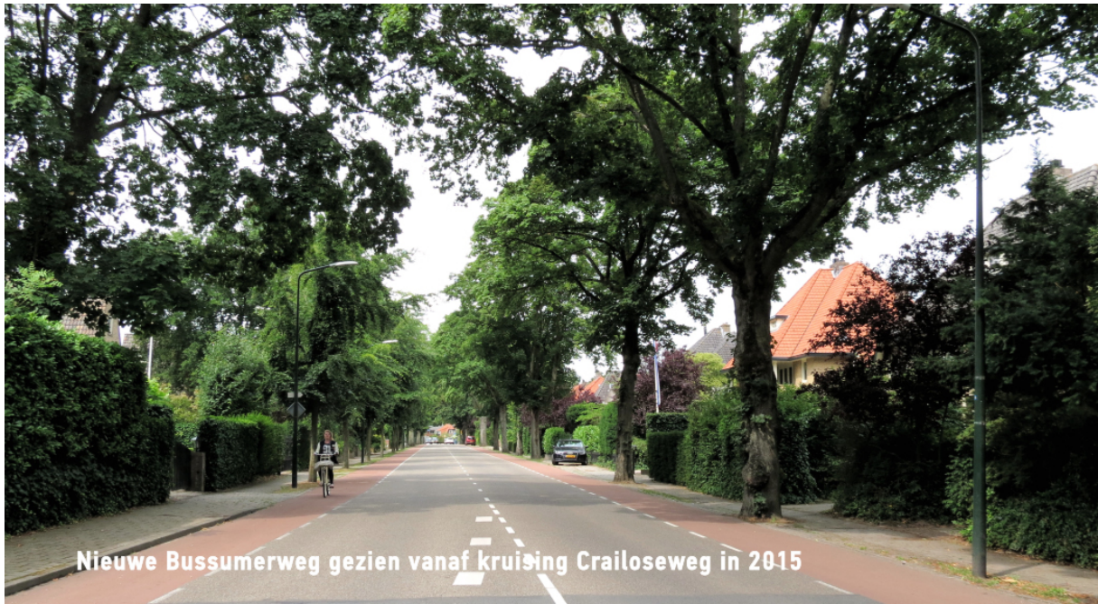
Nieuwe Bussumerweg gezien vanaf kruising Crailoseweg in 2015