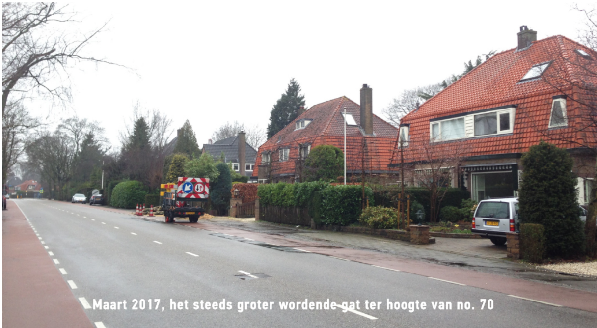
Maart 2017, het steeds groter wordende gat ter hoogte van no. 70