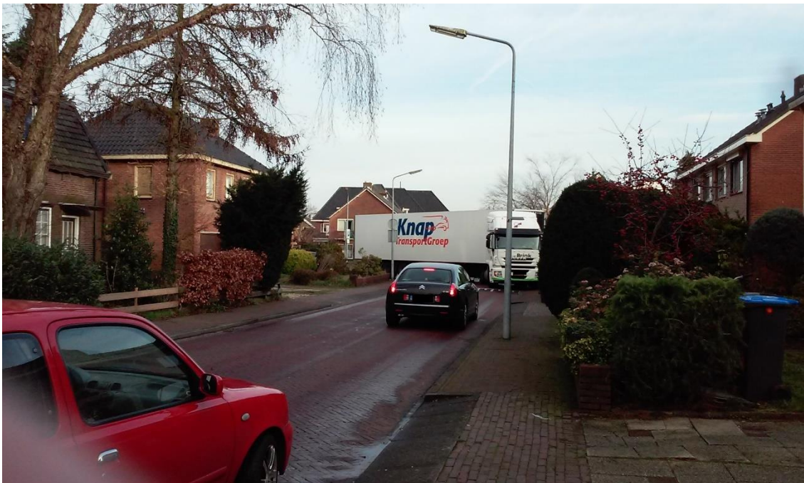
Vrachtauto komend uit Keucheniusstraat richting Tuinstraat