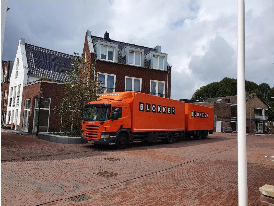
Vrachtauto in Keucheniusstraat