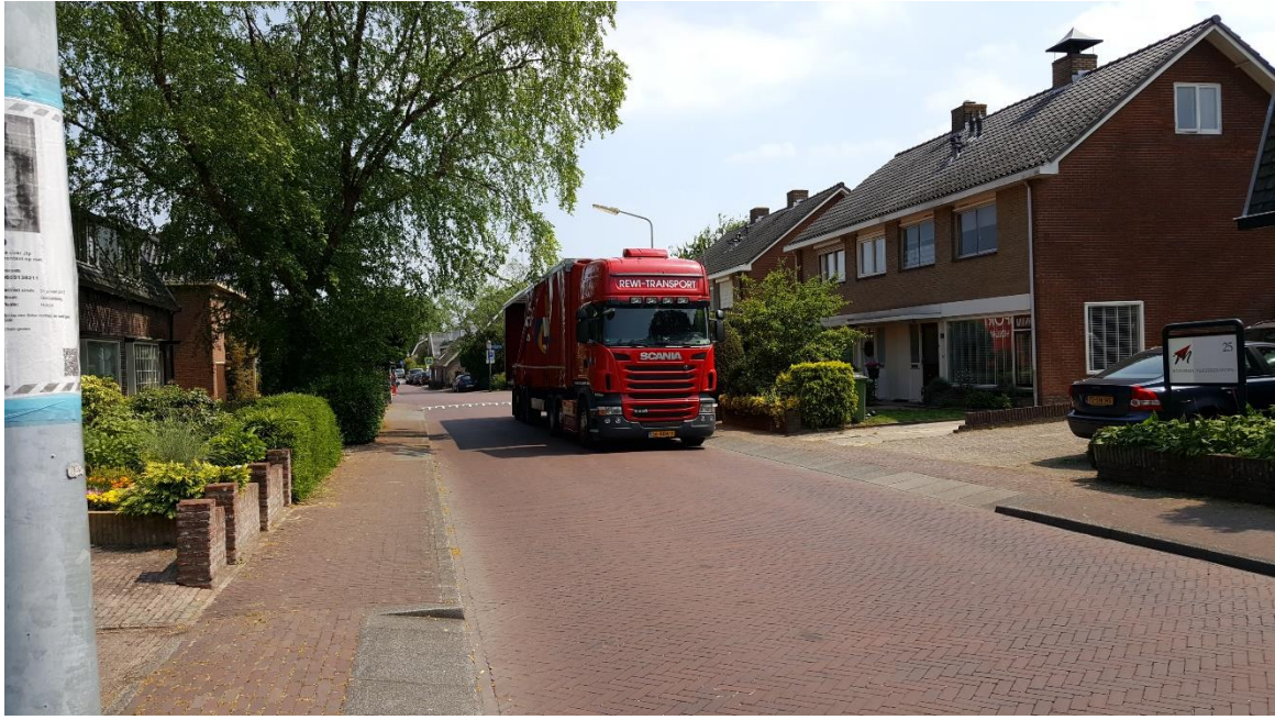
Vrachtauto rijdend in Tuinstraat