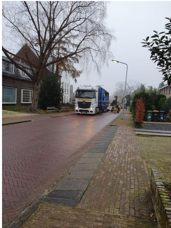
Vrachtauto steekt in Keucheniusstraat en lost aan Tuinstraat