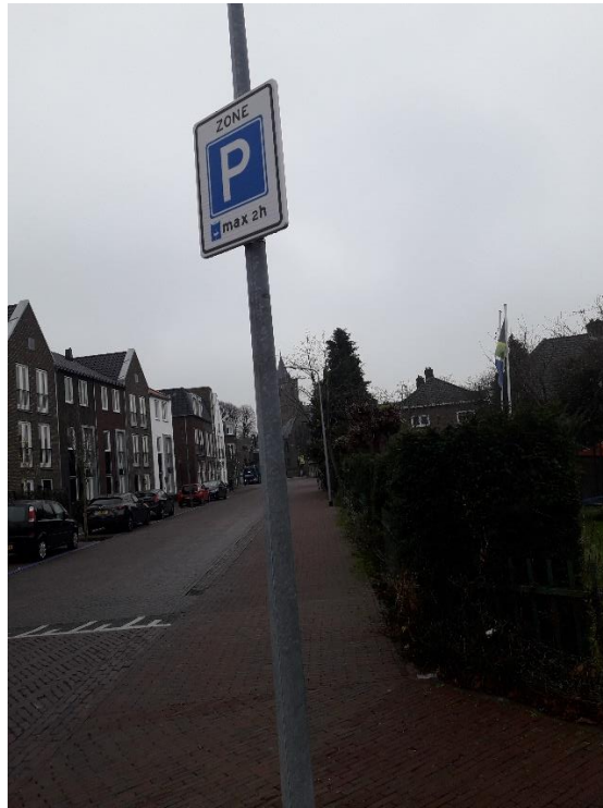
Keucheniusstraat zijde richting achterkant AH