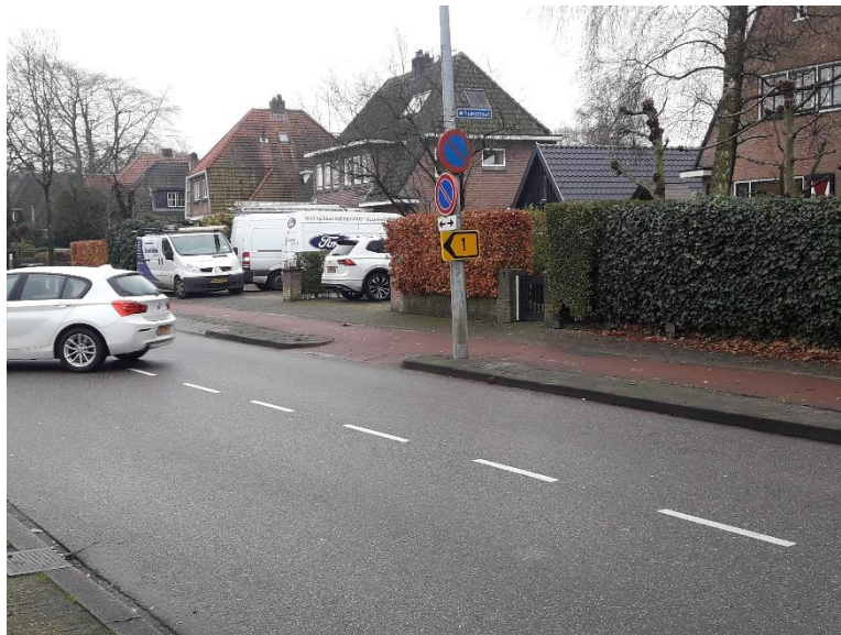
Vervolg wegomleiding 1 Dorp richting Tuinstraat