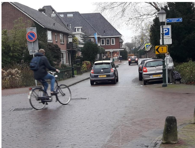
Vervolg wegomleiding 1 Dorp richting Keucheniusstraat