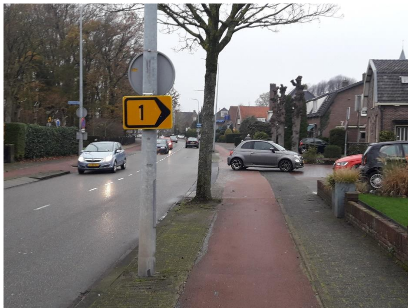
Wegomleiding 1 Dorp richting Tuinstraat