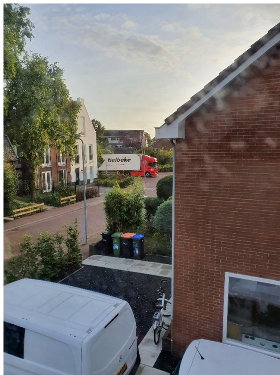
Vrachtauto achteruit rijdend Keucheniusstraat naar AH laadstation