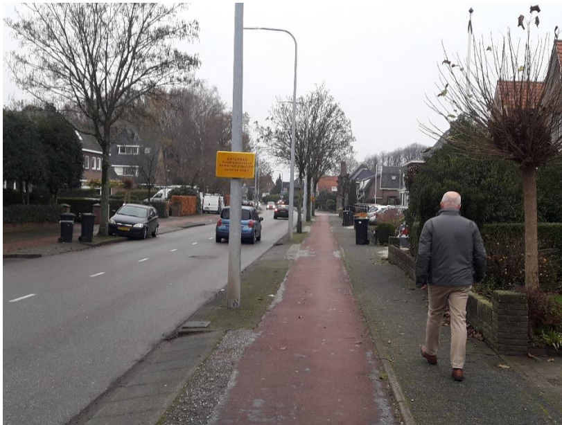
Vooraankondiging wegomleiding Dorp