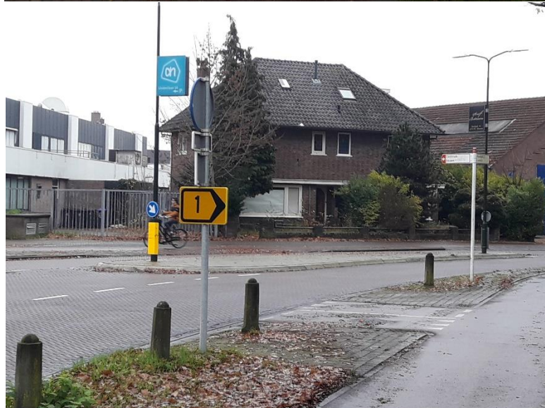
Wegomleiding 1 Dorp