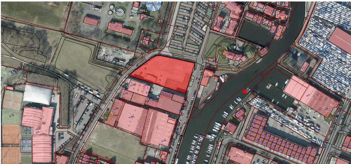
In rood de afbakening van de gemeentegrond/ het plangebied

De te ontwikkelen kavel is respectievelijk 5.120 m 2 groot. Het te ontwikkelen en te beoordelen gebied betreft alleen gronden die in eigendom zijn van de gemeente.