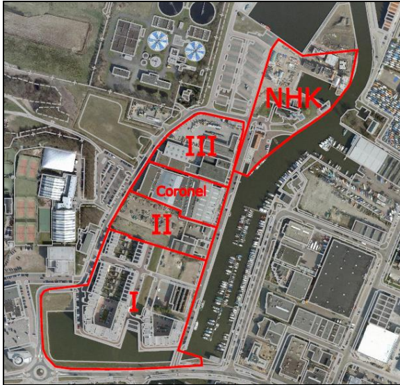
Fasering volgens de definitieve visie Oude Haven.

Feitelijk vormt het plangebied de overgang van bedrijvigheid naar commerciële en recreatieve functies in het Nautisch Kwartier. Gezien de diverse functies dient rekening te worden gehouden met bevoorrading, laden en lossen, geluid en geur. De realisering van woningen / appartementen alsook bedrijfsmatige functies is op de te ontwikkelen grond mogelijk.