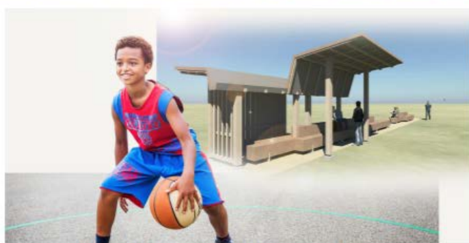
Verhard voet- en basketbalveld en een jongerenontmoetingsplek (JOP)