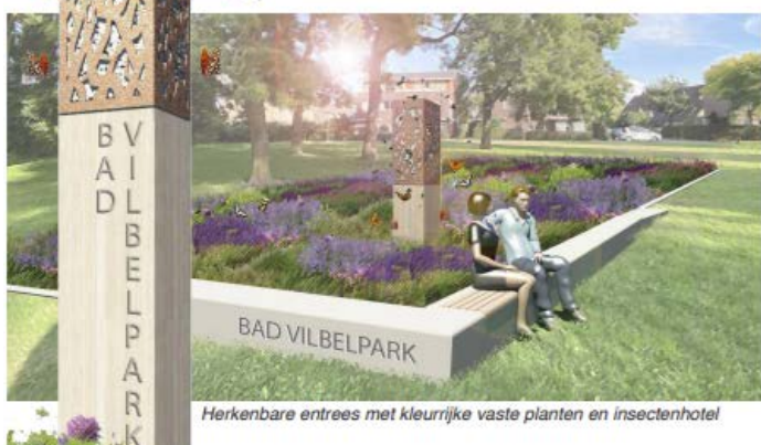
Herkenbare entrees met kleurrijke vaste planten en insectenhotel