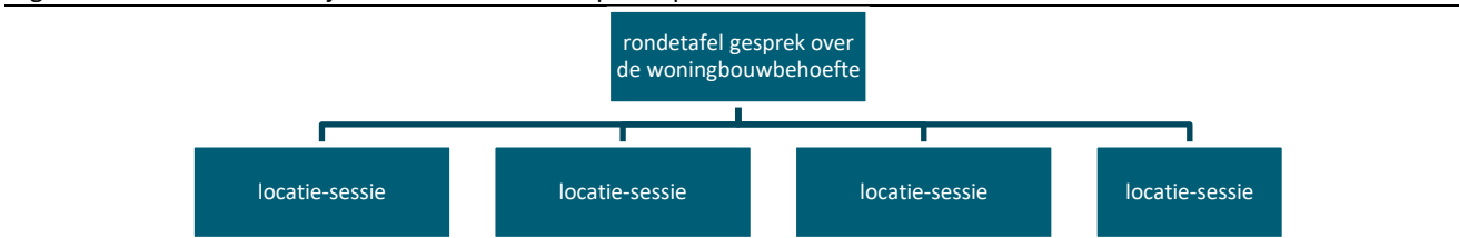
Figuur 2 Verschillende bijeenkomsten t.b.v. de participatie

De complexiteit van het onderwerp en het feit dat er verschillende belangen spelen, maakt dat het participatieproces uit meer dan een woonconferentie zou moeten bestaan. Al was het alleen maar omdat niet alle onderwerpen in 1 bijeenkomst aan bod kunnen komen. Maar ook de wens tot inclusiviteit maakt dat er verschillende participatievormen zullen moeten worden aangeboden (zie verderop). Daarnaast kan het wenselijk zijn om op verschillende momenten en in andere vormen met verschillende doelgroepen wordt geparticipeerd. Voor de maatschappelijke organisaties kan een rondetafelgesprek of conferentie worden georganiseerd. Inwoners kunnen het best benaderd worden later in het proces wanneer de locaties zelf worden uitgewerkt. Daarnaast kunnen op een online platform of via polls op social media meningen worden opgehaald. De gemeente zal een duidelijke fasering in het participatieproces moeten aangeven met heldere tussentijdse doelen en eisen die aan de deelproducten worden gesteld, anders zijn de aanbiedingen van de verschillende bureaus slecht met elkaar te vergelijken.