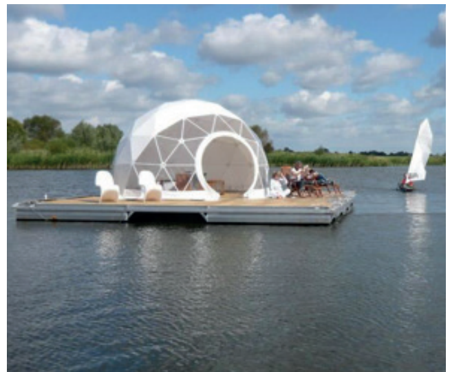
6 drijvende Dome-tenten als vrij drijvende overnachting in de baai van Huizen