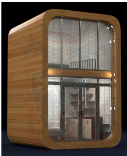
6 Tiny Houses worden geplaatst op een drijvende betonnen bak (zoals bijv. bij woonarken)

Hieronder voorbeelden van de 6 drijvende Tiny Houses en de 6 drijvende dome-tenten: