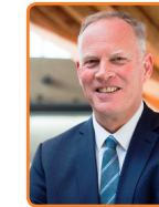
Gooise Meren, H. ter Heegde