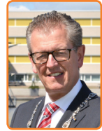
Zeewolde, G.J. Gorter