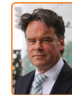
Openbaar Ministerie, R. Jeuken