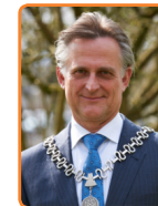
Soest, R. Metz