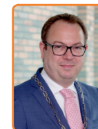
Eemnes, R. van Benthem