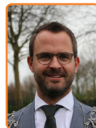
Lopik, L. de Graaf