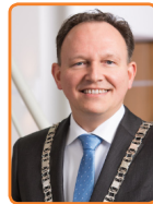
Stichtse Vecht, A. Reinders