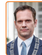
De Bilt, S. Potters