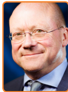
De Ronde Venen, M. Divendal