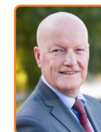
Bunnik, R. van Bennekom