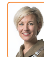
Wijk bij Duurstede, I. Meerts