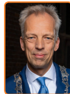
Vijfheerenlanden, S. Frölich