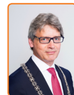
Amersfoort, L. Bolsius