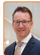
IJsselstein, P. van Domburg