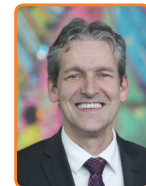
Rhenen, J. van der Pas