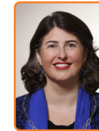
Blaricum, B. de Reijke