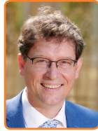
Noordoostpolder, R. de Groot