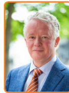
Dronten, J.P. Gebben