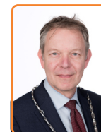
Baarn, M. Röell