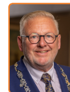
Bunschoten, M. van de Groep