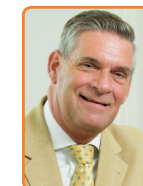
Utrechtse Heuvelrug, G. Naafs