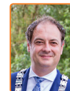
Leusden, G. Bouwmeester