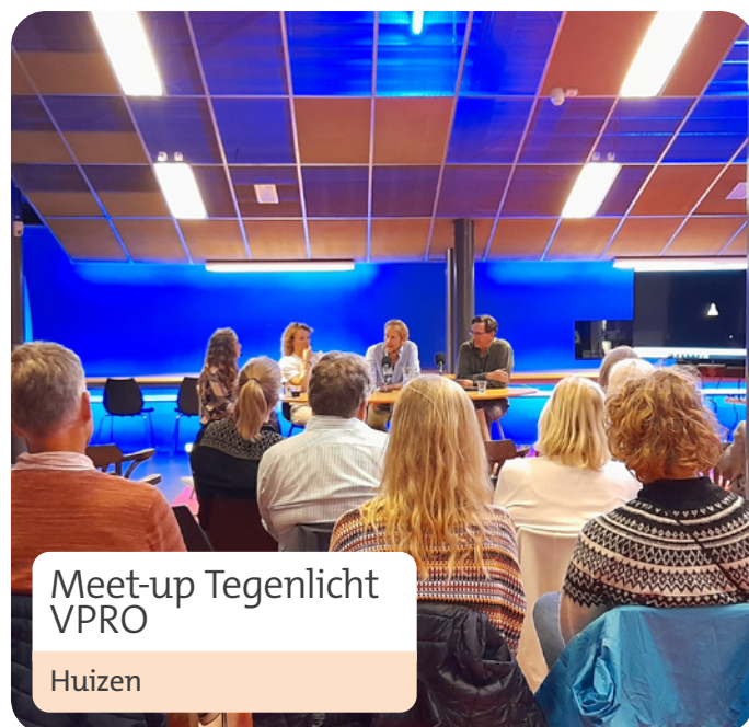
Meet-up Tegenlicht VPRO Huizen