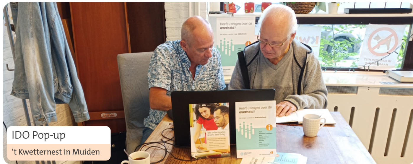
IDO Pop-up 't Kwetternest in Muiden