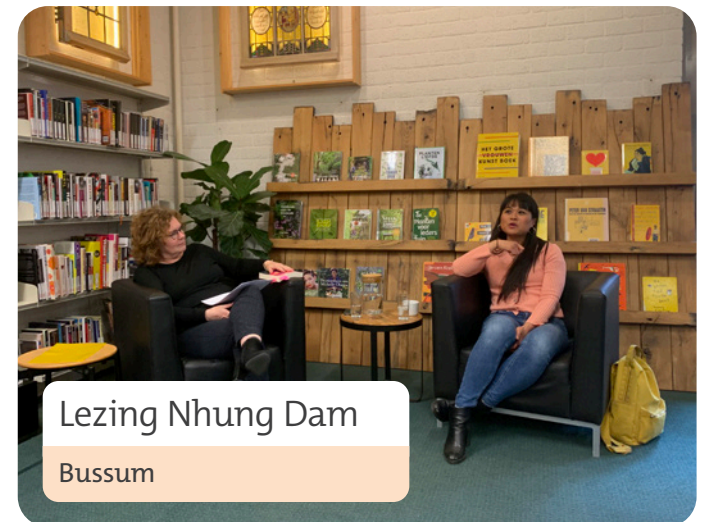
Lezing Nhung Dam Bussum