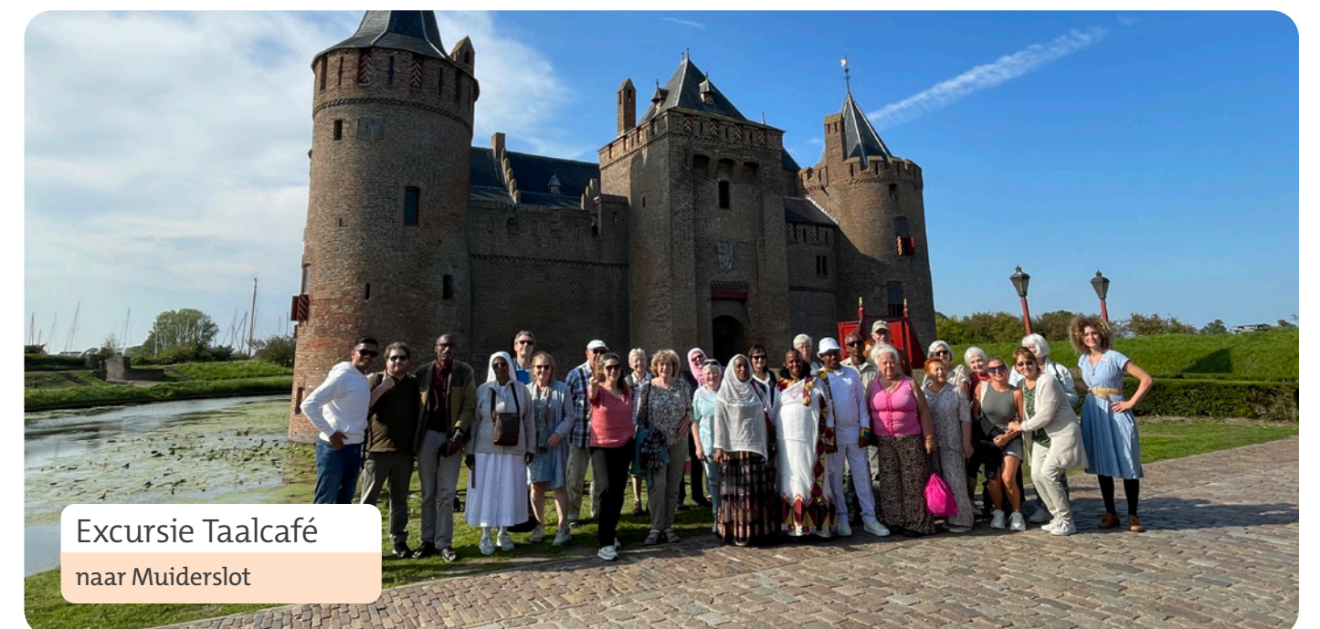
Excursie Taalcafé naar Muiderslot

NetWERK – werkzoeken voor Oekraïners - was afgelopen jaar in Eemnes, Huizen, Bussum en Naarden.