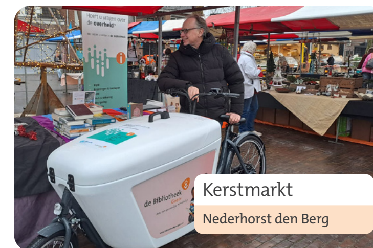
Kerstmarkt Nederhorst den Berg

In 2023 schaften we 2 bakfietsen aan. Om ons Informatiepunt Digitale Overheid te promoten, maar om ook met al onze andere activiteiten erop uit te gaan! Naar markten bijvoorbeeld.