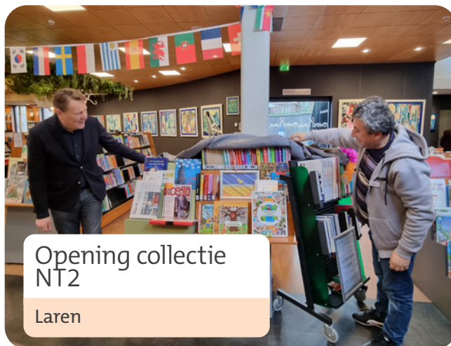
Opening collectie NT2