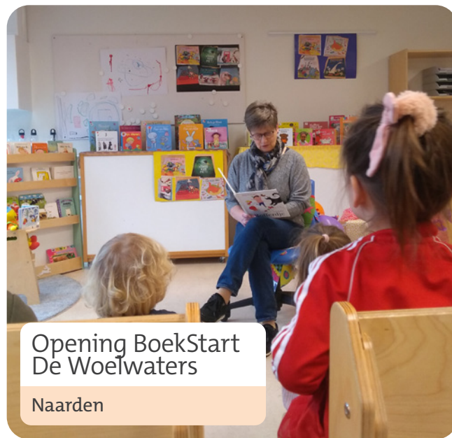
Opening BoekStart De Woelwaters

Wat is Boekstart in de kinderopvang? De bibliotheek ondersteunt met een aantrekkelijke voorleesplek in de kinderopvang, een collectie boeken, deskundigheidsbevordering voor pedagogisch medewerkers, betrekken van ouders en een voorleesplan waardoor (voor)lezen een vaste plaats krijgt op een locatie.