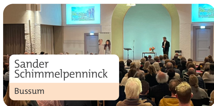
Sander Schimmelpenninck Bussum