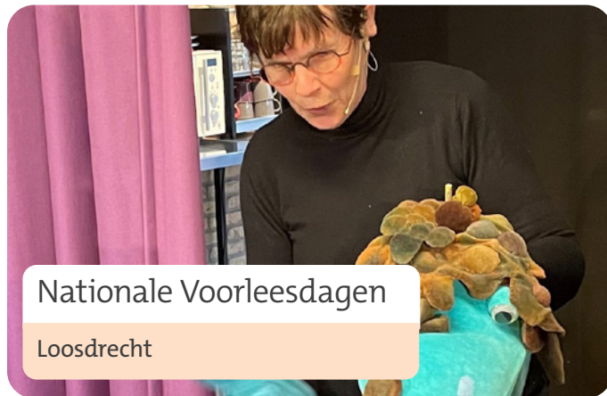
Nationale Voorleesdagen Loosdrecht