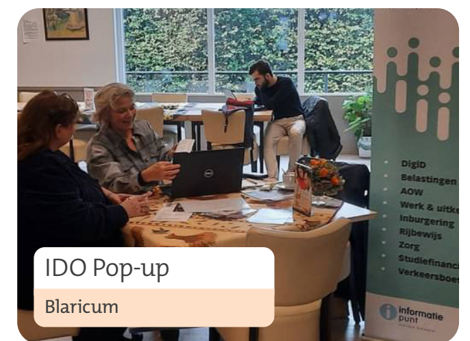
IDO Pop-up Blaricum