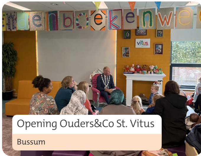
Opening Ouders&Co St. Vitus Bussum