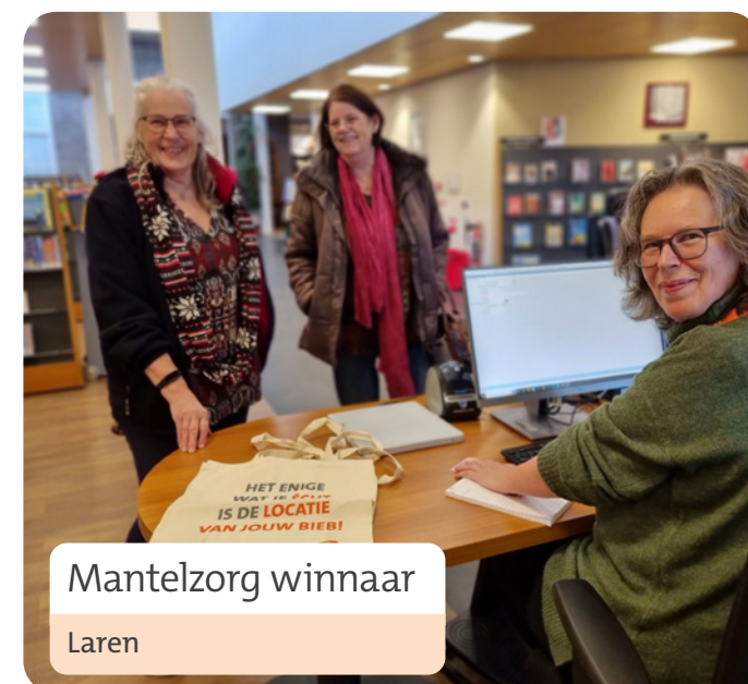
Mantelzorg winnaar Laren