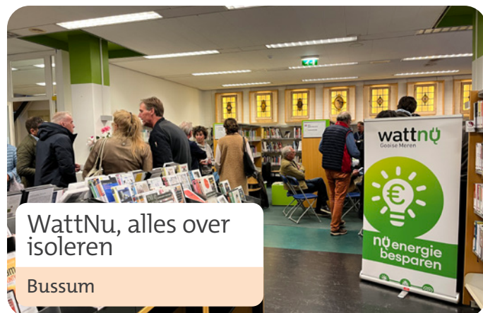
WattNu, alles over isoleren Bussum