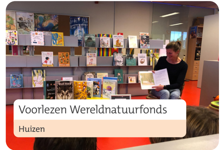
Voorlezen Wereldnatuurfonds Huizen