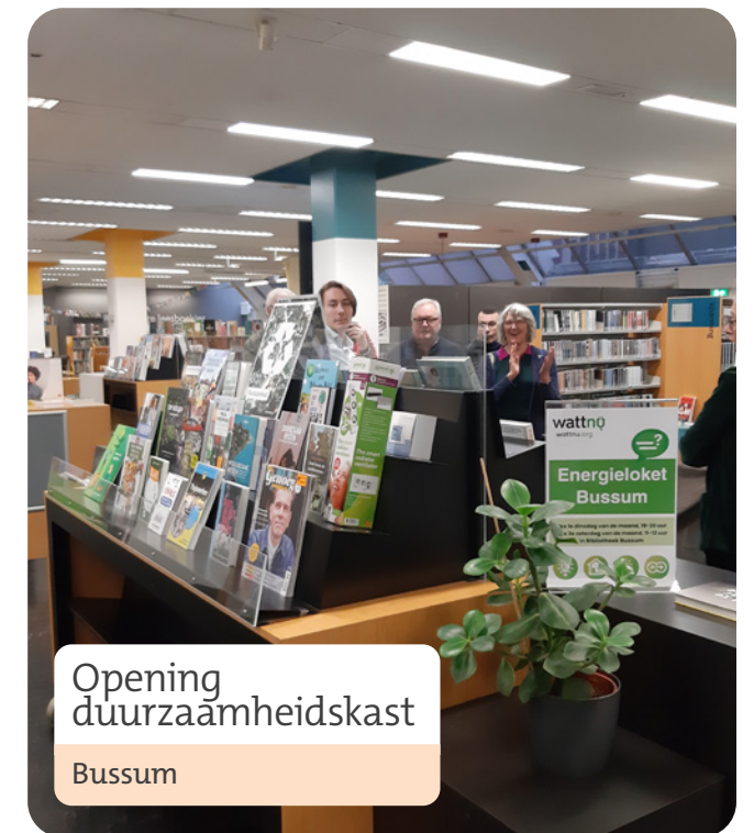
Opening duurzaamheidskast Bussum