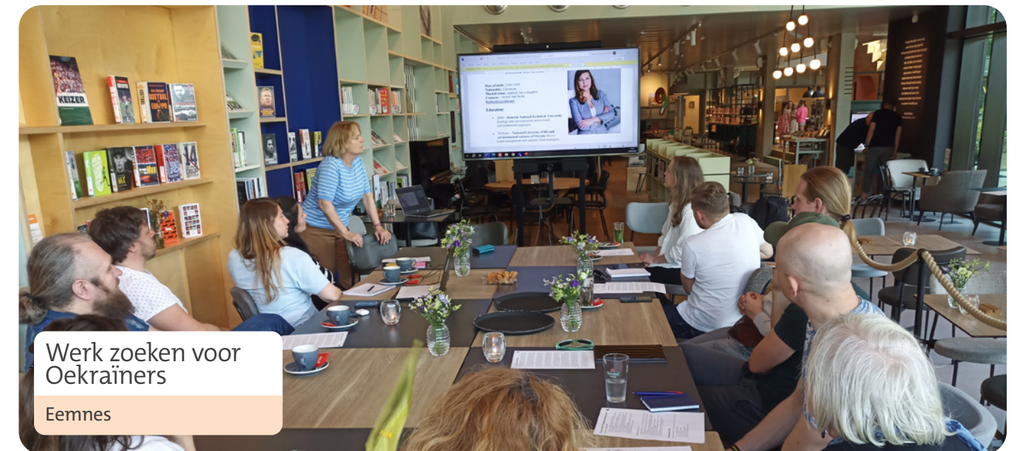
Werk zoeken voor Oekraïners Eemnes

NetWERK – werkzoeken voor Oekraïners - was afgelopen jaar in Eemnes, Huizen, Bussum en Naarden.