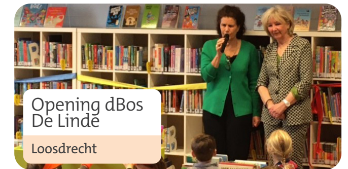
Opening dBos De Linde

In 2023 hebben we met 7 scholen een overeenkomst of een intentieverklaring getekend om een Bibliotheek op school te starten. We zijn volop bezig met de opstart. 27% van de scholen in ons werkgebied heeft een Bibliotheek op school.