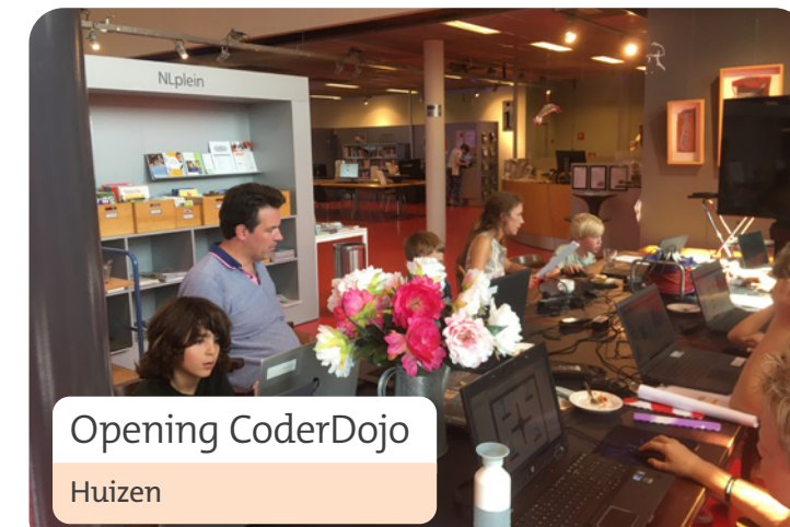
Opening CoderDojo Huizen

Het gaat goed met de bibliotheek. Het ledenaantal is gemiddeld gestegen met 2,5% en het aantal bezoekers met 10%. Hier en daar zijn er natuurlijk verschillen te zien, waarover meer te lezen valt in het inhoudelijke jaarverslag. Onze activiteiten werden goed bezocht en er werden heel veel vragen beantwoord in ons Informatiepunt Digitale Overheid. We hebben mooie resultaten bereikt binnen het Leesoffensief samen met de scholen en kinderdagverblijven, 56% van de kinderdagverblijven heeft een Boekstart in de kinderopvang en er zijn steeds meer scholen met een Bibliotheek op school. We hebben onze contacten met verschillende partners uitgebreid en met het voortgezet onderwijs verstevigd om ook ontleding bij jongeren tegen te gaan en te werken aan hun media-wijsheid.