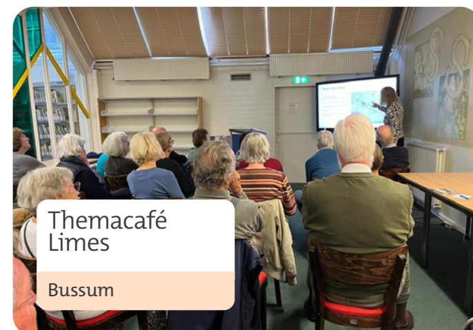
Themacafé Limes Bussum