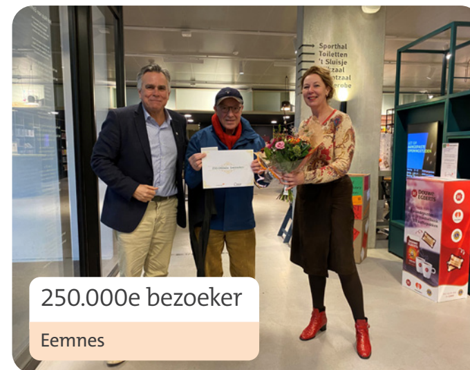
250.000e bezoeker Eemnes