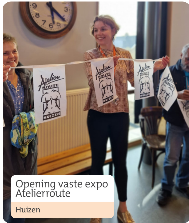
Opening vaste expo Atelierroute