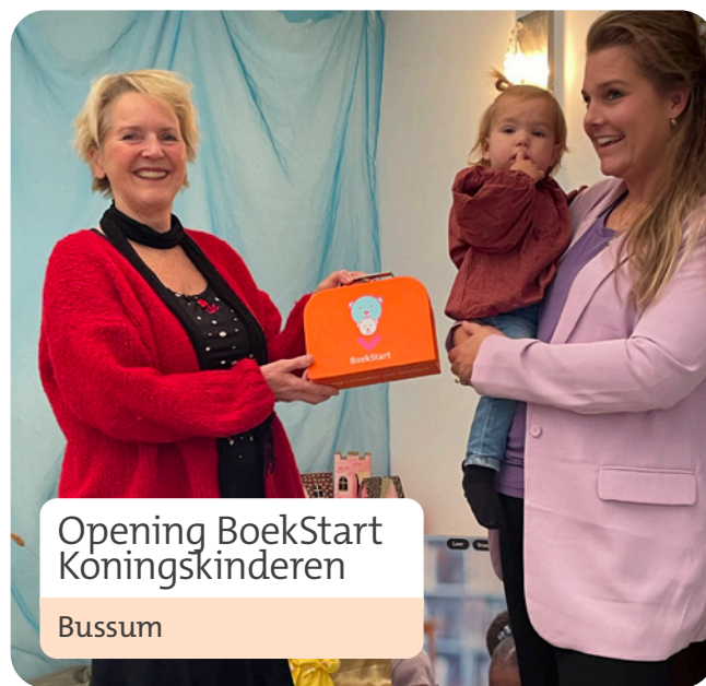
Opening BoekStart Koningskinderen