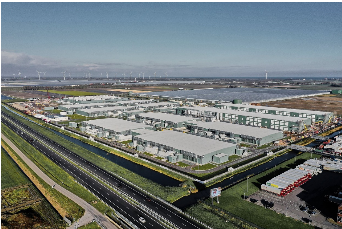
Overzicht situatie Datacenter Middenmeer 70 ha